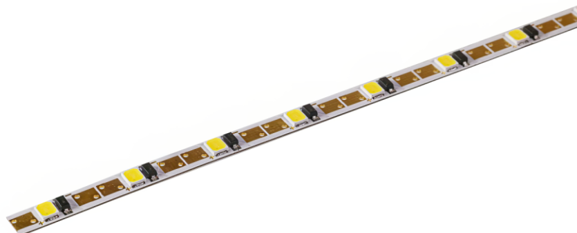
Anja 15 mm Artikelnummer: 5 1124 077

Die LED-Platine Anja ist eine universell einsetzbare Platine für die Reihenschaltung. Sie wird in allen gängigen Hansen-Profilen und im Flächenlicht eingesetzt.